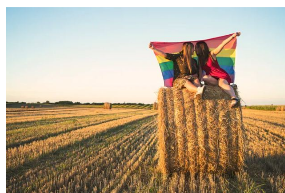
Sexilio: el exilio que viven las personas de diversidad sexual y de género en el ámbito rural