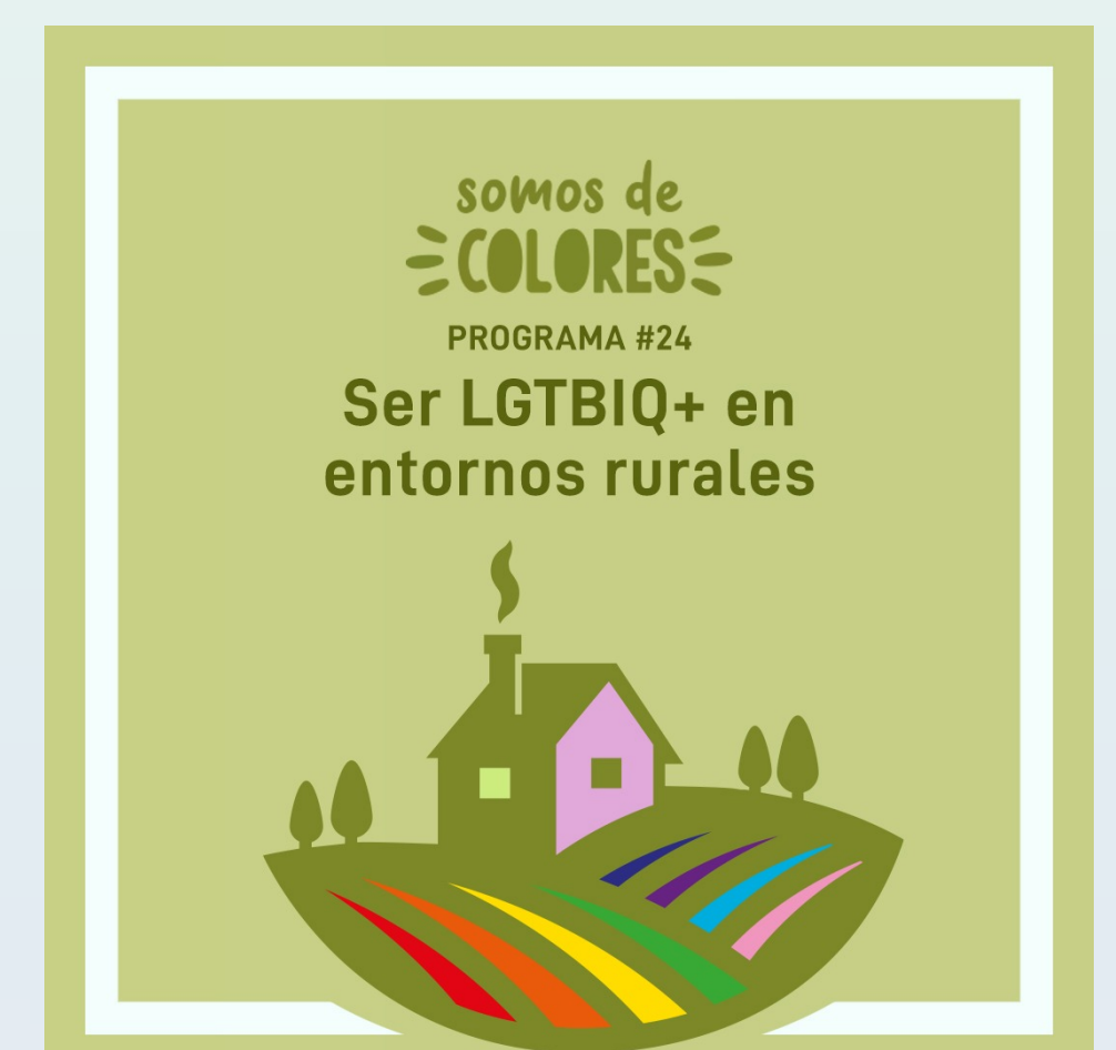
"Ser LGTBIQ+ en entornos rurales" (Somos de Colores, Podcast) Disponible en Ivoox.com 17/11/2022