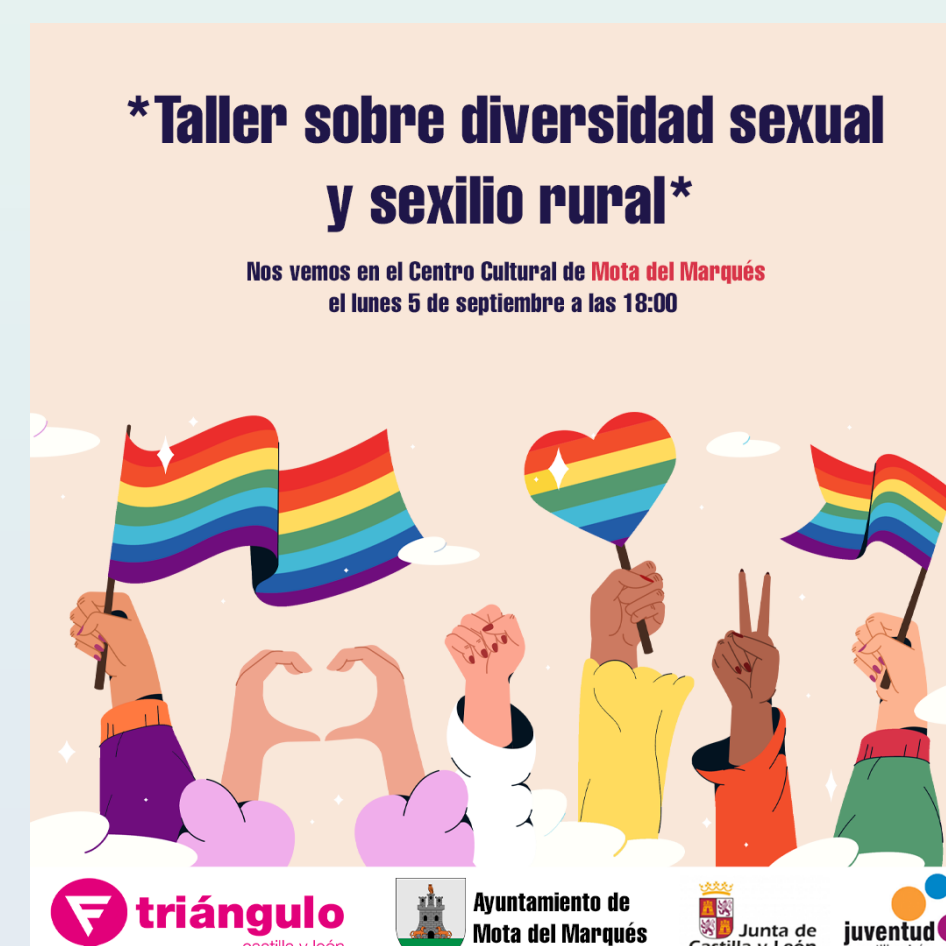
"Taller sobre diversidad sexual y sexilio rural" (Fundación Triángulo Castilla y León) 05/09/2022